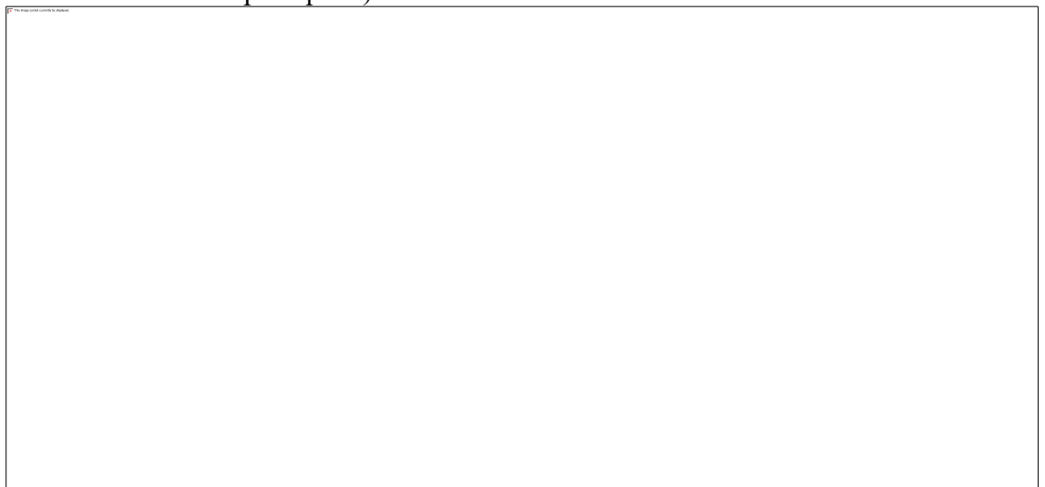
Joonis 2 Väljavõtte DP tehnovõrkude jooniselt